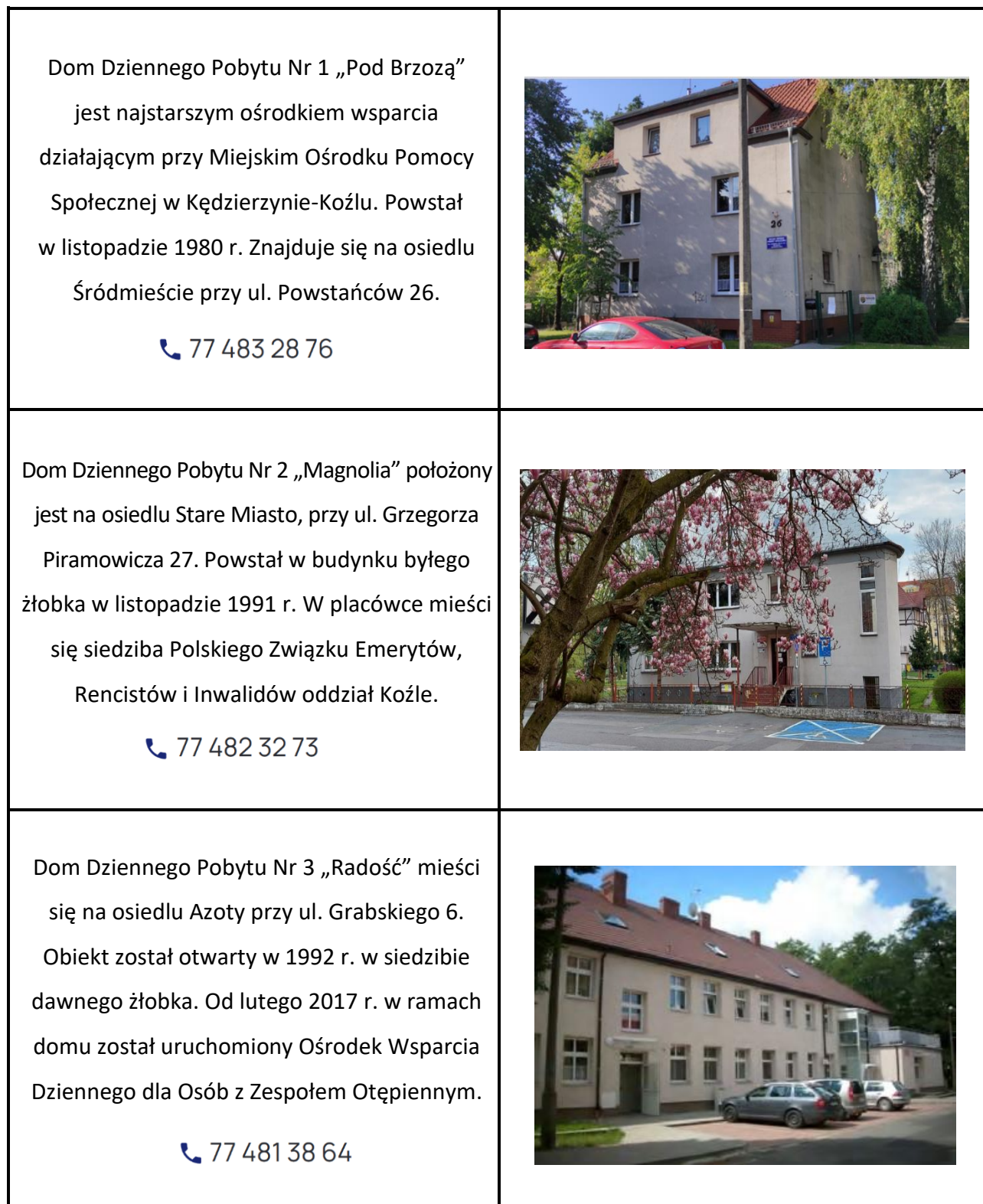
Tabela nr 17. Charakterystyka domów dziennego pobytu w Kędzierzynie-Koźlu

Koźle z dnia 29 grudnia 2016 r. w sprawie ustalenia szczegółowych zasad ponoszenia odpłatności za pobyt uczestników w Ośrodku Wsparcia Dziennego dla osób z zespołem otępiennym, funkcjonującym w ramach Domu Dziennego Pobytu Nr 3 Miejskiego Ośrodka Pomocy Społecznej w Kędzierzynie-Koźlu.