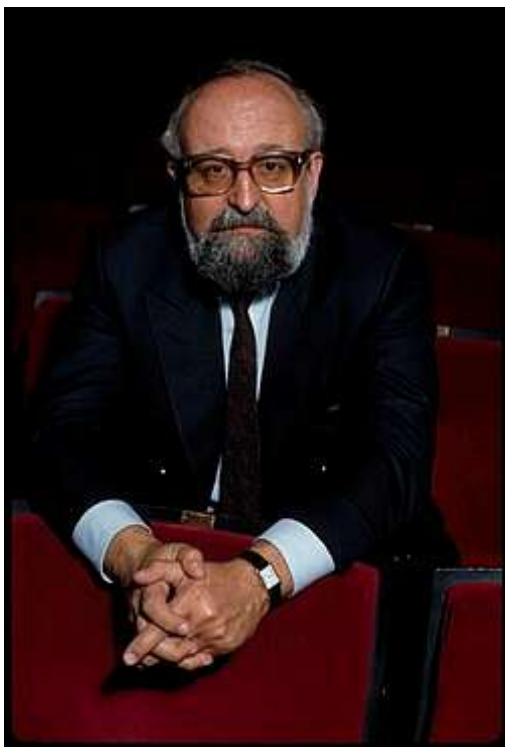
Penderecki w latach 80.

Założył międzynarodową akademię muzyczną Europejskie Centrum Muzyki w Łusławicach, gdzie mieszkał od 1976. Otwarcie akademii odbyło się 21 maja 2013.